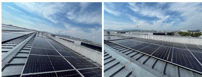
图1：项目实景图照片

N型 TOPCon 电池以其卓越的效率和可靠性，已经成为市场上的主流产品，在2024年的市场份额约为80%。尽管如此，众多光伏企业为了在竞争激烈的市场中实现产品差异化并提升产品价值，纷纷将焦点转向BC型单面组件，并将其作为屋顶光伏市场的主导产品。BC组件凭借其较高的正面功率输出，理论上非常适合屋顶安装应用。在屋顶安装环境中，BC电池的双面性劣势可以得到显著缓解。鉴于此，我们决定在江西上饶开展一项全面的实地测试研究。江西上饶的季风湿润气候和全年-5至35°C的平均气温，为评估不同光伏组件的性能提供了理想的自然条件。这将有助于我们深入理解各种组件在实际应用中的表现，从而为未来的产品开发和市场策略提供科学依据。